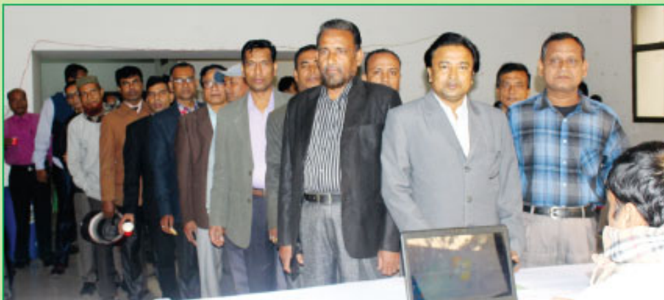
৩৫তম বার্ষিক সাধারণ সভায় উপস্থিত সম্মানিত শেয়ারহোল্ডারবৃন্দের নিবন্ধনকরনের একাংশ।