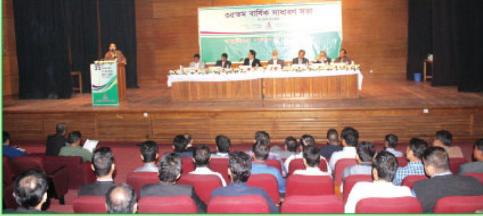
৩৫তম বার্ষিক সাধারণ সভায় সম্মানিত শেয়ারহোল্ডার বক্তব্য রাখছেন।