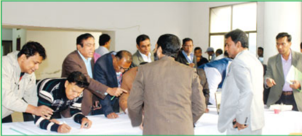
৩৫তম বার্ষিক সাধারণ সভায় উপস্থিত সম্মানিত শেয়ারহোল্ডারবৃন্দের এ্যাটেনডেন্স ট্রিপ সঞ্চাহের একাংশ।